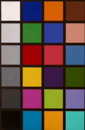
GretagMachbeth - ColorChecker Color Rendition Chart